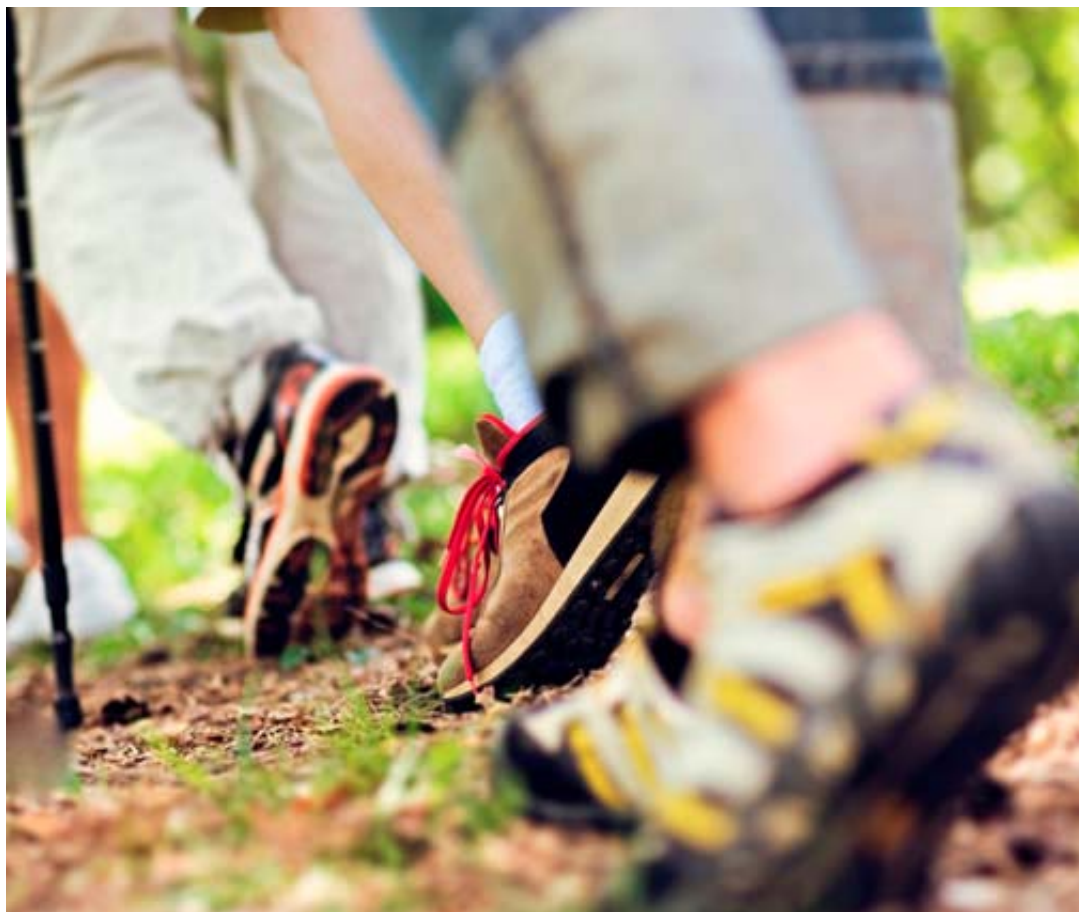
Les trois amies ont partagé leurs réflexions sur le Carême au cours d'une de leurs marches. Extraits.