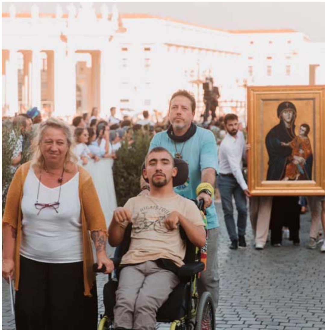
Le peuple de Dieu en marche, signe d'espérance. Together2023, rassemblement du peuple de Dieu à Rome, le 30 septembre 2023.

Se sachant «pèlerins d'espérance», les personnes interrogées sont un peu plus prolixes