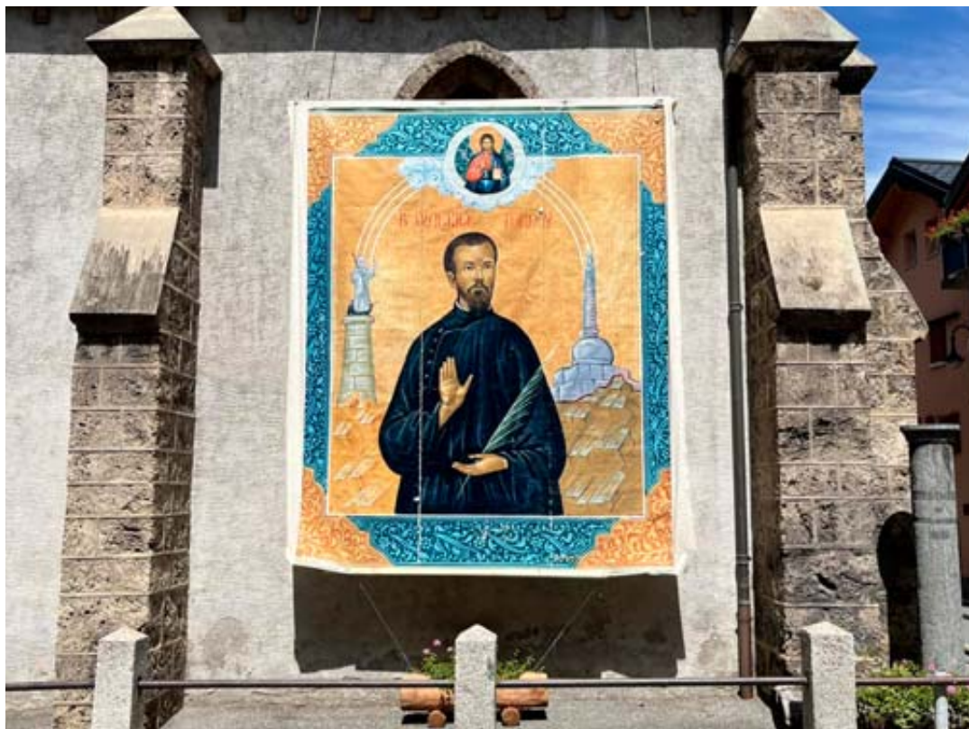
Toutes les chorales de la vallée chanteront à l'église d'Orsières en souvenir du bienheureux Maurice Tornay.

La messe du 20 octobre prochain à Orsières sera particulière puisqu'elle sera spécialement dédiée au bienheureux et