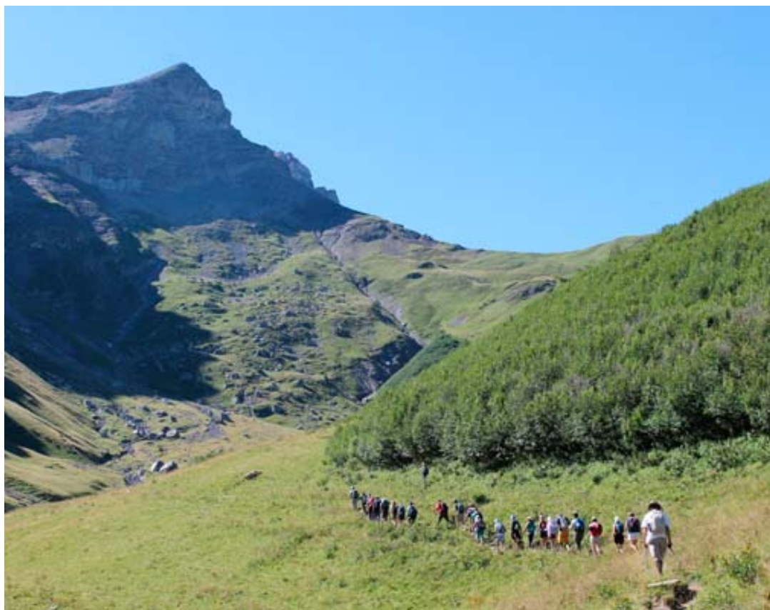
La retraite «randonnée» du Foyer de Charité de Bex, en août 2020, dans la vallée de Javerne.

Les Eglises, et toutes les religions en général, sont pleinement conscientes que la nature est une des multiples voies d'accès au Dieu Créateur.