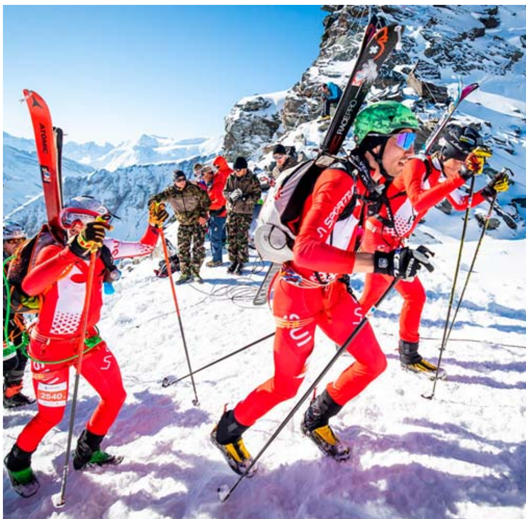
Cette année, le slogan de la Patrouille des glaciers sera «ensemble au cœur de l'effort». Une maxime valable également pour la vie spirituelle.

Toujours plus haut: la devise olympique rejoint la spiritualité chrétienne, à condition que l'être humain ne compte pas que sur ses propres performances!