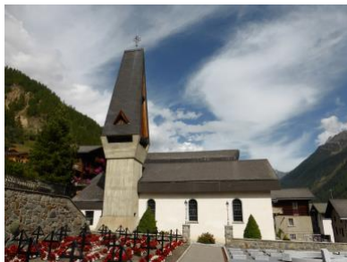
Pfarrkirche Wiler

Am Wochenende vom 6./7. Januar 2024 wird in allen Pfarreien der Schweiz ein Opfer aufgenommen, mit dem die Inländische Mission die Restauration von Kirchen unterstützt. In diesem Jahr erhält auch die Pfarrei Wiler im Lötschental eine finanzielle Hilfe für die Restauration der Pfarrkirche Maria Königin des Friedens.