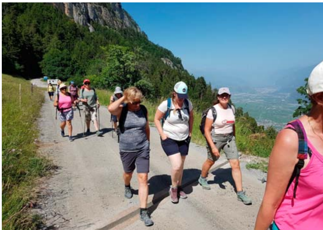
Le pélé des femmes au cœur de mère aura lieu les 15-16 juin.

Prendre soin de soi, de son couple, pour prendre soin de sa famille, c'est ce que la pastorale des familles vous souhaite, et c'est l'une des missions qui lui a été confiée: proposer des temps de ressourcement humain et spirituel, des temps de pause pour sortir du quotidien et prendre un peu de recul pour poser le regard sur sa vie. S'arrêter pour souffler, échanger avec d'autres femmes et hommes qui partagent les mêmes défis de vie, oser l'ouverture aux autres, s'enrichir mutuellement au contact les uns des autres, parce que chacun a sa contribution unique et personnelle à apporter à ce monde. Se mettre à l'écoute de nos grands frères et sœurs dans la foi, ceux et celles qui ont percé un peu les mystères de la Vie et qui ont témoigné de leur expérience, soit par leur exemple de vie, soit par leurs écrits. Décider de poser les boulets de nos vies que sont les soucis, les blessures, les trahisons... Puiser à la source d'Amour dans une rencontre personnelle avec Dieu et repartir dans nos lieux de vie avec un élan renouvelé, une espérance plus vive, un