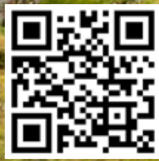
Marchons ensemble!

marche, dans le processus synodal, l'horizon qui s'ouvre à l'Eglise, nous ne le connaissons pas encore, il s'envisage peu à peu dans la conversation spirituelle et dans le discernement ensemble.