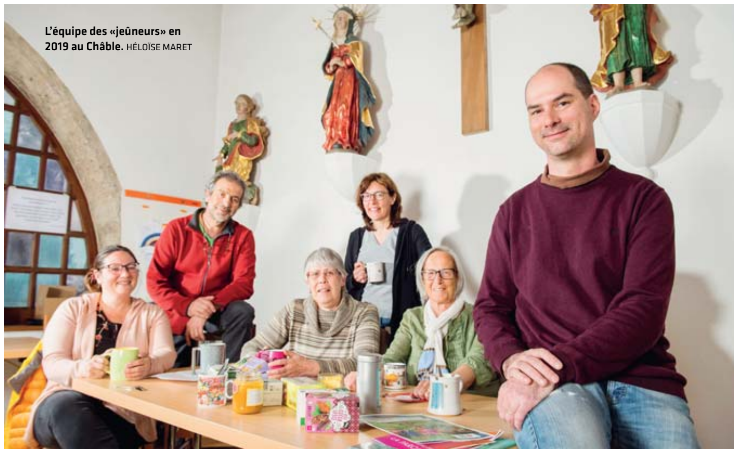
L'équipe des «jeûneurs» en 2019 au Châble.

CARÊME Pourquoi jeûner durant le carême? Pourquoi tant de nos contemporains vivent des expériences de jeûne au cours de séjours de bien-être?