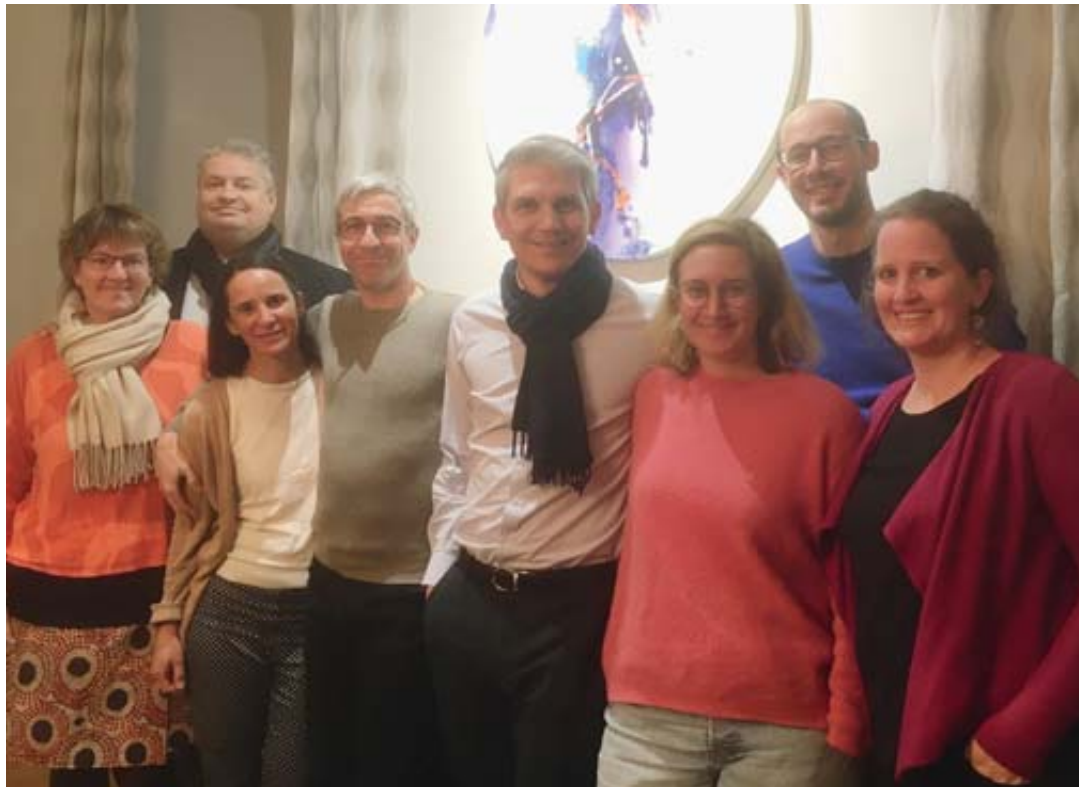
Le comité d'organisation du Festival des familles 2022. DR

Après deux ans d'absence en raison de la pandémie, le Festival des familles revient ce dimanche 13 mars au Labyrinthe Aventure à Evionnaz. A quelques heures de ce rendez-vous traditionnel, rencontre avec ses organisateurs.