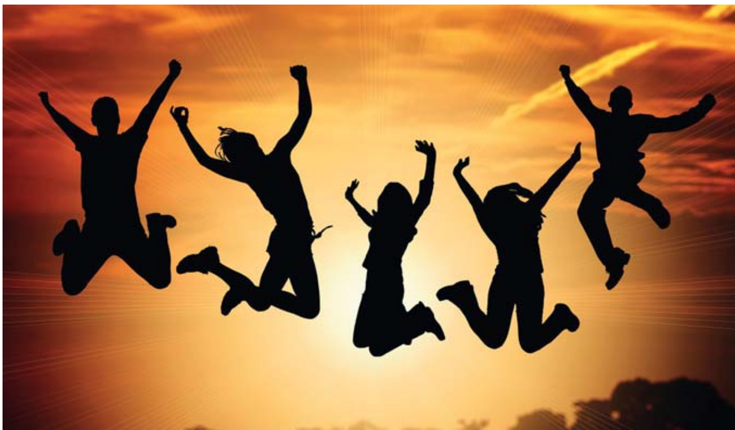
La joie des retrouvailles.

RENTRÉE Pour les communautés chrétiennes, c'est aussi la rentrée ces jours. Si les célébrations se vident des touristes qui ont passé l'été dans nos régions, elles commencent à se remplir de celles et ceux d'entre nous qui reviennent joyeusement... Pas seulement de vacances d'ailleurs.