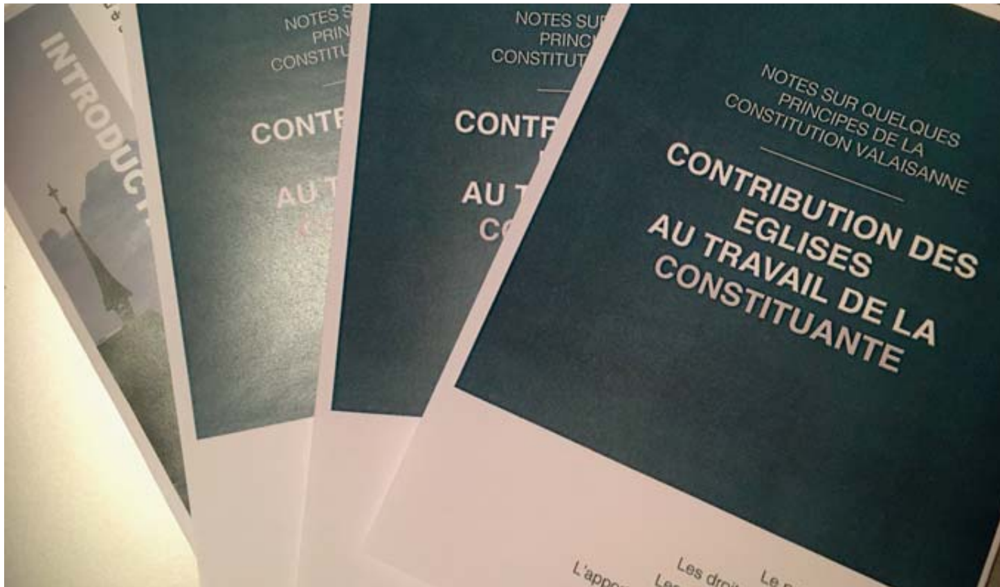
Les Eglises ont publié une plaquette dans le cadre de la consultation sur la nouvelle Constitution cantonale rédigée par l'assemblée constituante. DR

CONSTITUTION Alors que le processus de l'assemblée constituante connaît une nouvelle étape, les Eglises valaisannes prennent position et publient une plaquette.