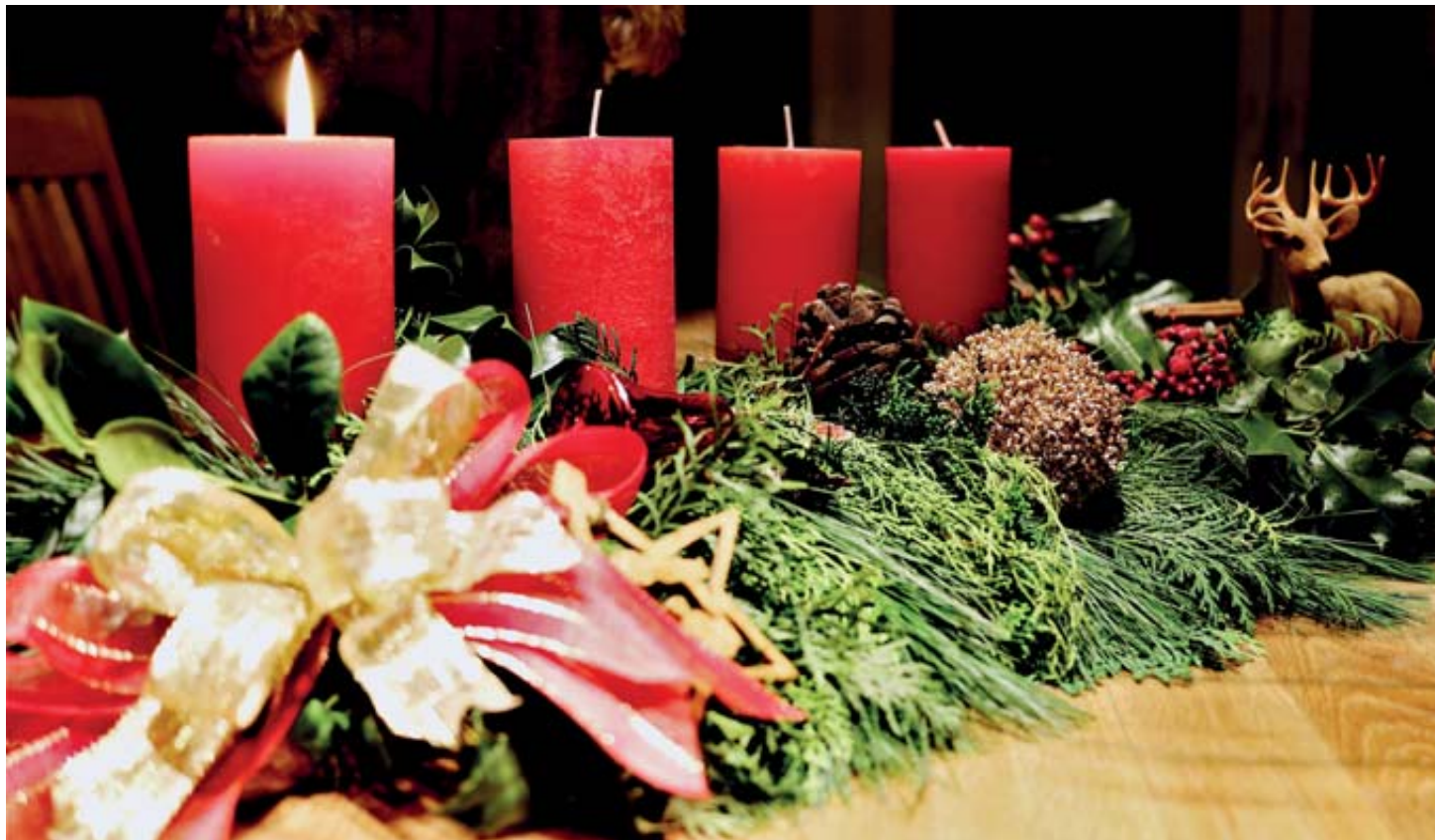
La lumière de l'Avent fait briller l'espérance dans la nuit pour préparer Noël.

TÉMOIGNAGES Comment aborder le temps de l'Avent en «mode Covid»? Des anonymes d'ici et d'ailleurs nous donnent leur vision de cet Avent atypique. Leur espérance éclaire la nuit de la pandémie.