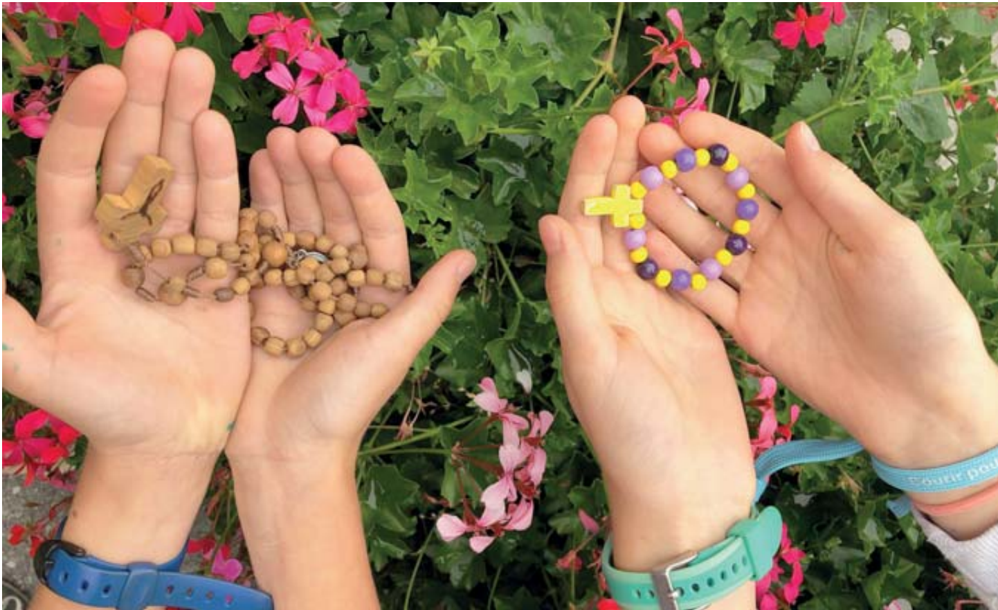
A Chamoson, des enfants sont fidèles à la récitation du chapelet quotidien après l'école. Concrétisant ainsi le vœu réitéré de la Vierge Marie lors de ses apparitions.