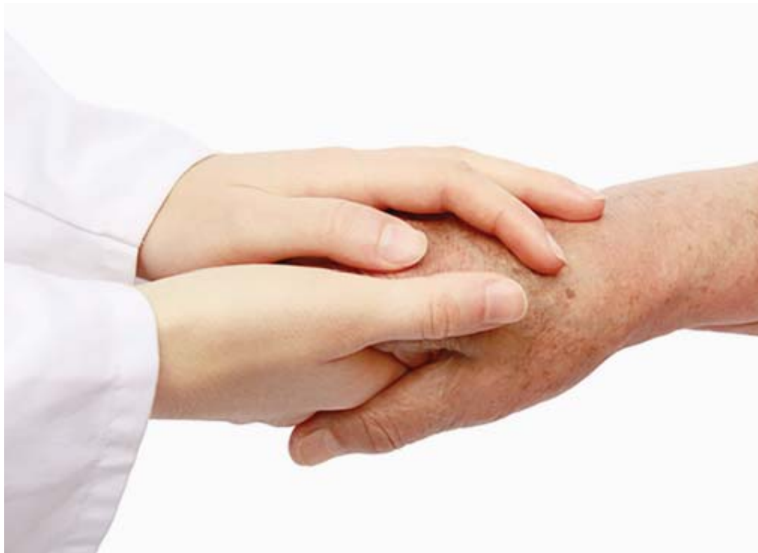
Les personnes en EMS ont droit à un accompagnement spirituel si elles le désirent.

Tout résident d'un EMS du canton a droit à un accompagnement spirituel. Loi et convention fixent les modalités de ce soutien souvent si précieux.