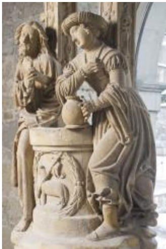
Voici, tirée du diaporama de la Samaritaine, avec l'autorisation du Musée d'art et d'histoire de Fribourg

Pour la deuxième fois, l'Association biblique catholique de Suisse romande (l'ABC) va consacrer sa session d'été à la Pelouse-sur-Bex, du 28 (ou 30) juin au 2 juillet aux « femmes dans la Bible », Une session faite de lectures bibliques, partages, célébrations, ouverte à tous. En collaboration cette fois-ci avec le Service de catéchèse du canton de Vaud, avec, durant l'année pastorale 2017, une exposition et des soirées-conférences.