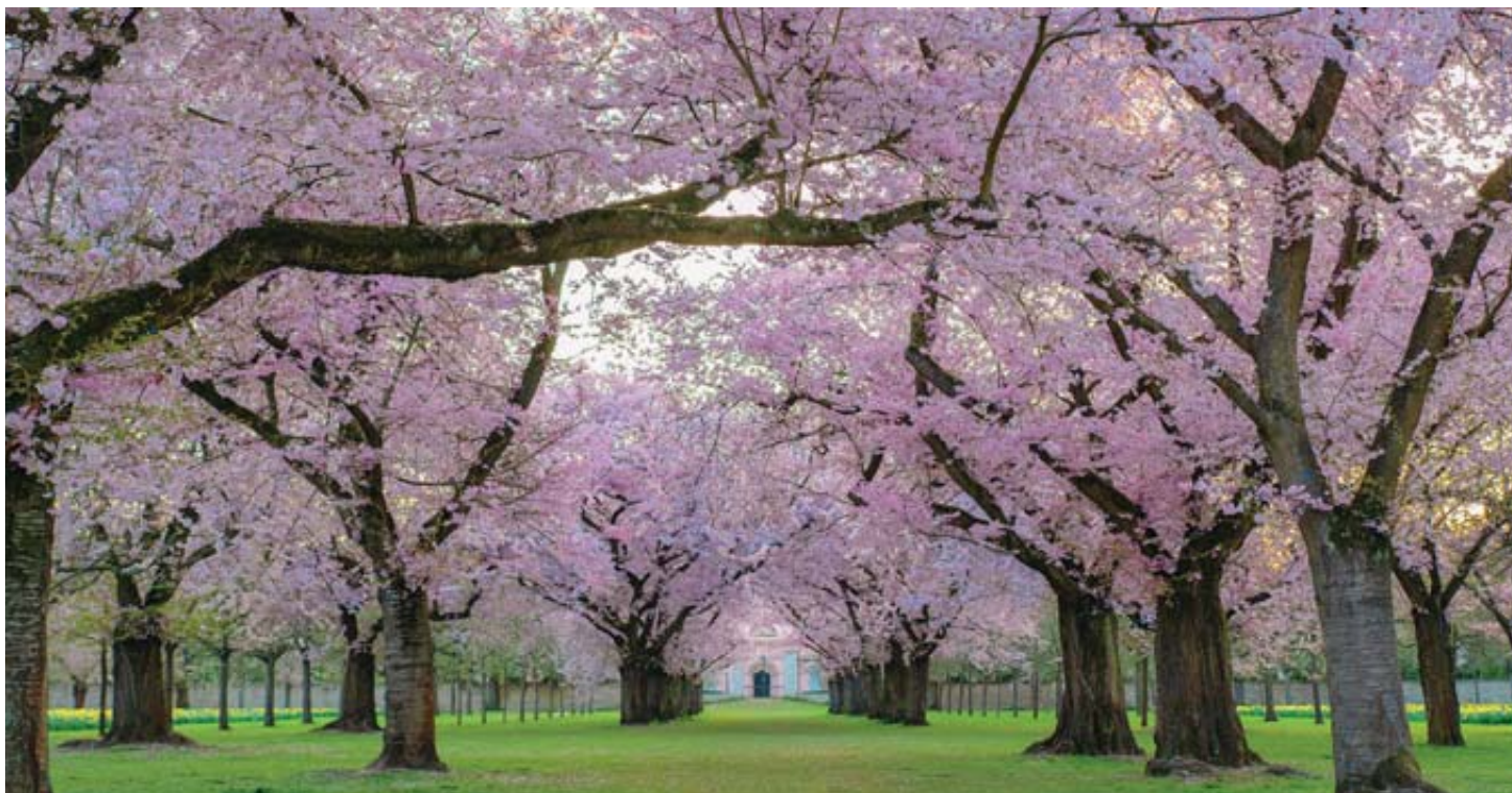
Comme le retour du printemps, croyons en la résurrection.

PÂQUES Près de la moitié des chrétiens, disent les statistiques, préfèrent croire en la réincarnation plutôt qu'en la résurrection. Une folie lorsqu'on sait ce que recouvrent vraiment ces deux termes!