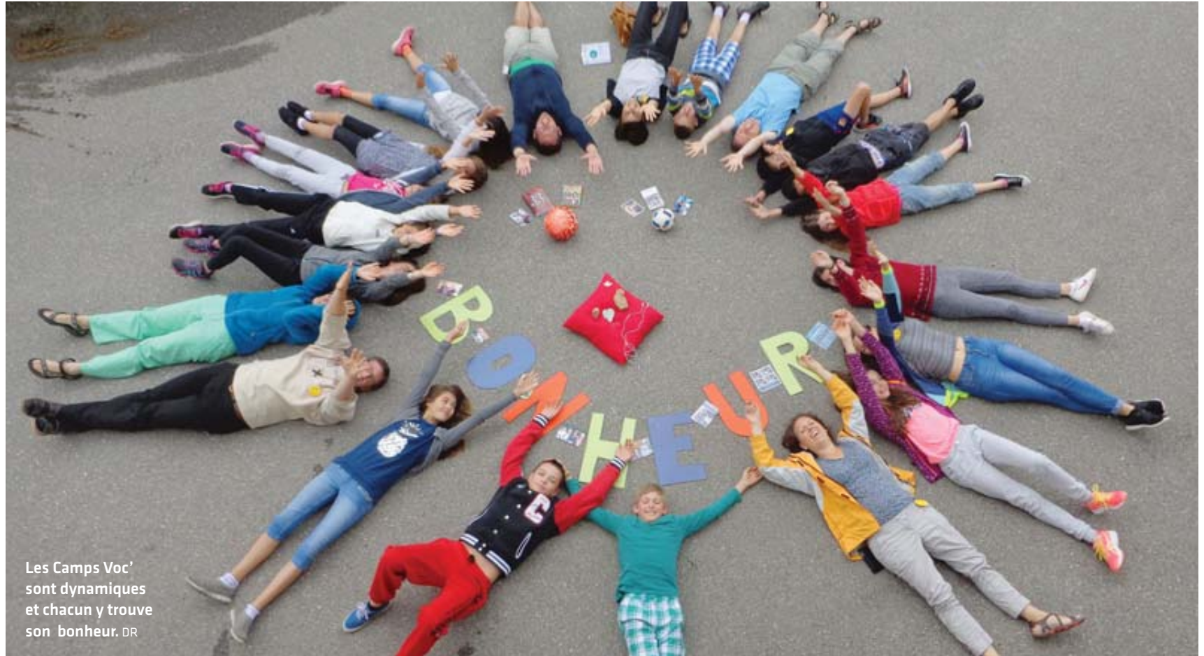
Les Camps Voc' sont dynamiques et chacun y trouve son bonheur.