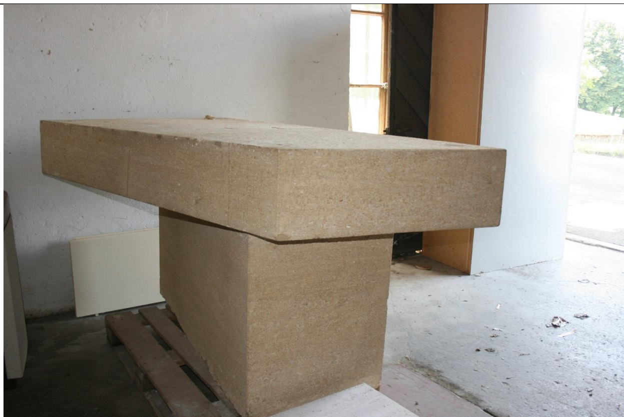
Vue de l'ensemble de l'autel composé du bloc supportant l'autel et de la table