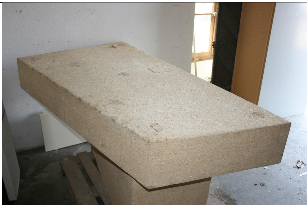
Vue du dessus de la table avec la boîte à reliques